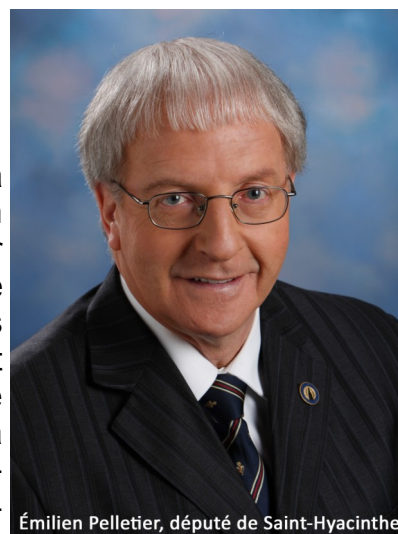
Émilien Pelletier, député de Saint-Hyacinthe

Le CAPVISH s'est déplacé à l'Assemblée Nationale le 10 juin dernier pour rencontrer Monsieur Émilien Pelletier, porte-parole de l'opposition officielle pour les personnes handicapées et l'OPHQ. Nous répondions à une invitation de Monsieur Pelletier à venir échanger avec lui sur les différents enjeux vécus par les personnes à mobilité réduite. Les questions du transport, du soutien à domicile, des aides techniques et de l'inclusion sociale furent parmi celles abordées lors de cette rencontre. Ce fut un moment agréable et enrichissant pour les deux parties. Le CAPVISH continuera sa collaboration avec Monsieur Pelletier en l'informant de l'actualité et des dossiers chauds concernant les personnes à mobilité réduite pour le grand territoire de la Ville de Québec.